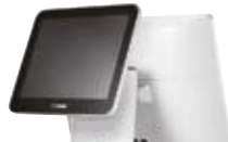
Secondo Display • 9.7", 15" LCD