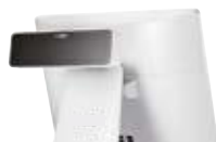
Display Cliente • VFD (2 Linee x 20 Caratteri)